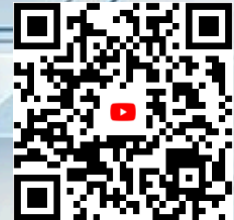
↑ 113 台南資訊月亮點花絮