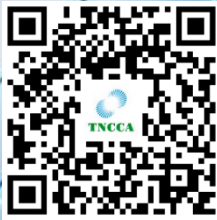
↑ 公會官網 QRcode