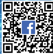
↑ 公會 FB QRcode